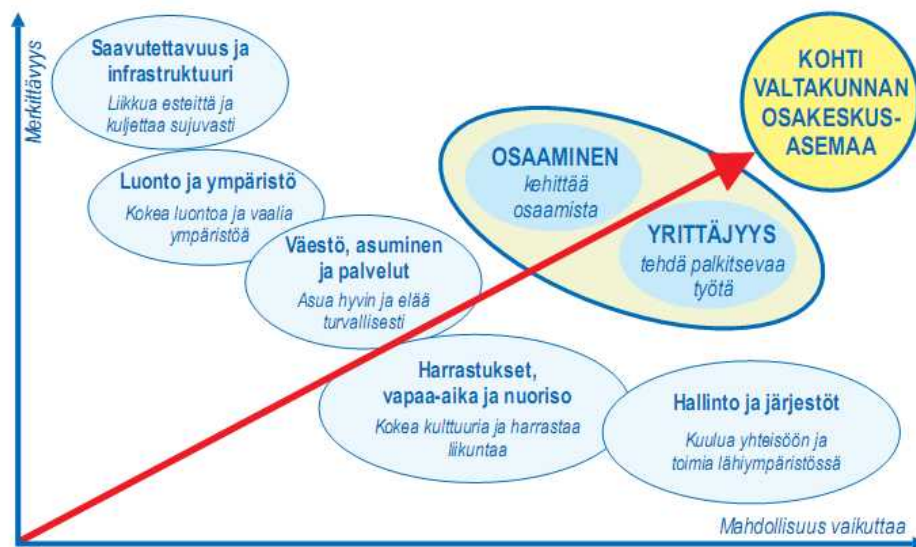
Kuva 2. Maakuntastrategian vaikuttavuus/merkittävyyssmatriisi 2005

Edellisessä maakuntasuunnitelmassa 2005 on viimeksi määritelty Päijät-Hämeen kehittämisen strategiset tavoitteet, jotka perustuvat maakunnan kehittyvään asemaan ja kasvavaan rooliin Suomessa ja maailmalla.