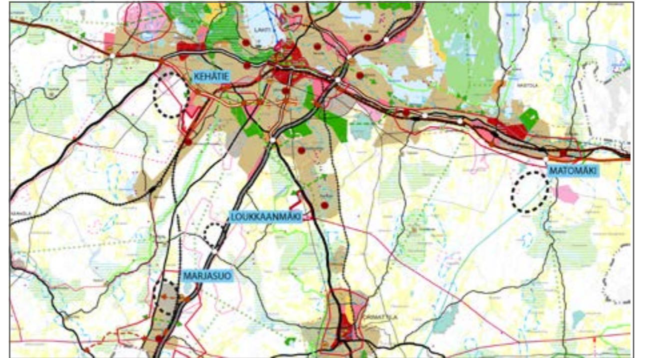
Kuva: Kartta Lahden seudulla tutkittavista jätteenkäsittelyalueen (Lahden seudun Kierrätyspuiston) sijaintivaihtoehdoista Päijät-Hämeen maakuntakaavan 2014 päällä esitettynä

Maakuntakaavaan laadittavien selvitysten ja YVA-menettelyn aikana syntyvien selvitysten pohjalta suunnittelualue karsiutuu ehdotusvaiheessa esitettävään ratkaisuun.