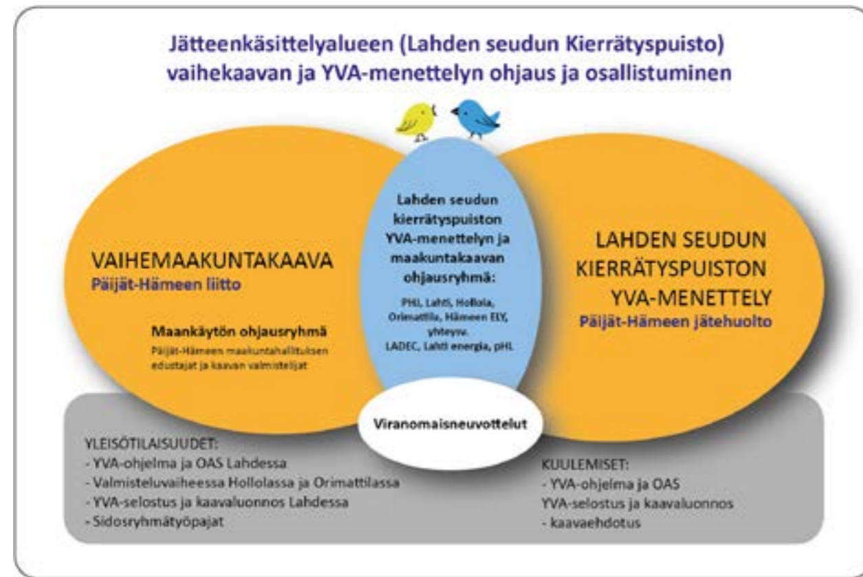
Kuva: Vaihemaakuntakaavan ja YVA-menettelyn ohjaus ja osallistuminen

YVA-menettelyn ja vaihekaavan yhteensovittamista varten on perustettu ohjausryhmä (kts. kuva alla). Ohjausryhmässä sovitaan yhteiset yleisötilaisuudet ja laaditaan tarkempi suunnitelma tiedottamisesta.